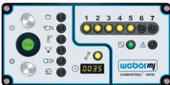
COMPATROL®-MSM signalisiert: Wartungs-Intervall erreicht.