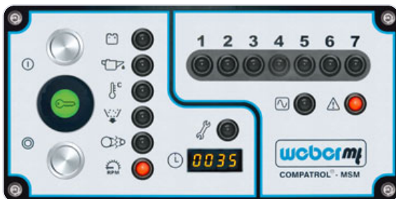
COMPATROL®-MSM zeigt an: Motordrehzahl nicht in Ordnung. Ursache überprüfen. Verdichtungsmessung nicht möglich.