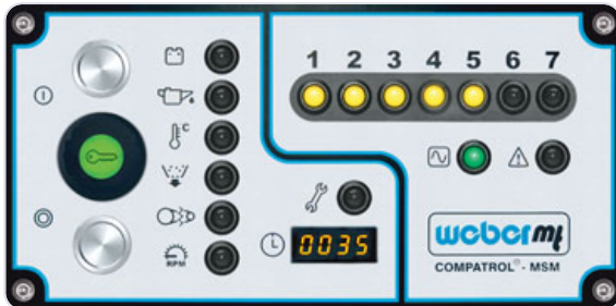
COMPATROL®-MSM: Display-Anzeige während der Verdichtung.