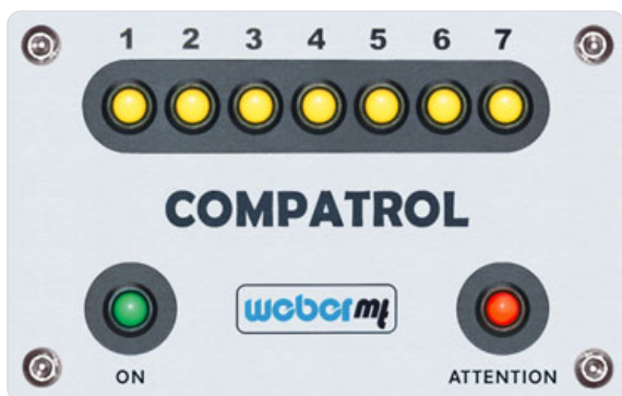
COMPATROL®-CCD meldet: „Verdichtung abbrechen, maximale Verdichtung erreicht“.