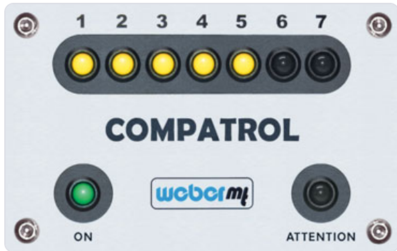
COMPATROL®-CCD: Display-Anzeige während der Verdichtung.