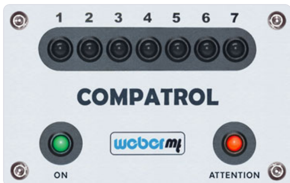
COMPATROL®-CCD zeigt einen Fehler an: „kein tragfähiger Untergrund, Boden ist nicht zu verdichten.“

„Fortschritt durch Qualitätssicherung auch in beengten Arbeitsräumen“