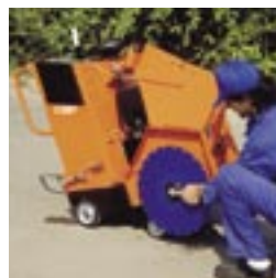
Zugänglichkeit für Keilriemen-spannung und -kontrolle.