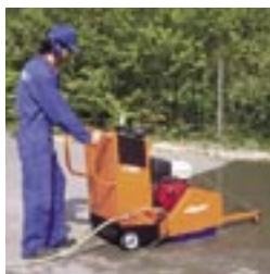
Tiefeneinstellung und Vorschub über Handrad.