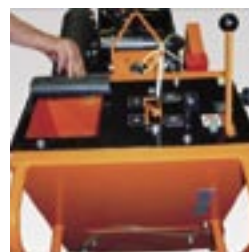
Bedienpult mit Wasser-Einfüllöffnung.